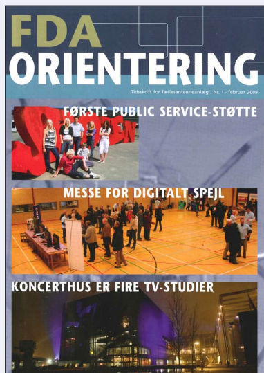
Nr. 1 · 2009