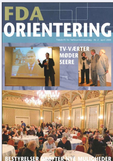
Nr. 2 · 2009